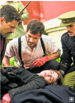
Una de las escenas finales de &#39;La señora&#39;, con la muerte de la protagonista.

Otra historia de los revanchistas de la izquierda española.